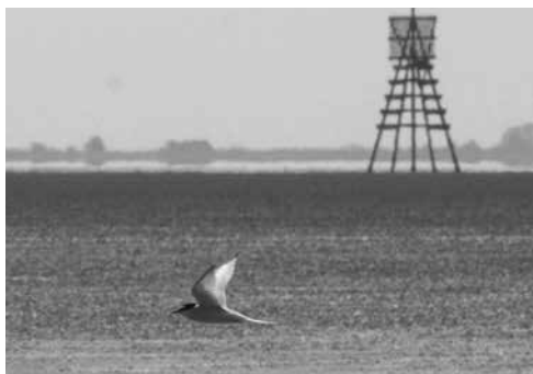
Ook de Krukel vindt het moeilijk de Visdieven van de Noordse sterns te onderscheiden.

zij waren al heel vroeg opgestaan. Toen Robbert zich met de zes kano's per marifoon meldde bij Verkeerspost Schiermonnikoog, kreeg hij de waarschuwing dat er een stevig onweer werd verwacht, maar ze konden niet vertellen hoe laat. Langzaam liep het water weg en kwam het mooie landschap van de geul tussen Engelsmanplaat en