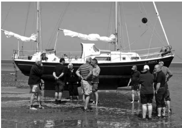
Ontmoeting van de monitorders bij de Vamos.

Zoals bekend is er een aantal mensen dat meedoet aan “Oog voor het Wad”, het monitoren van de effecten van de vaarrecreatie op de natuur in de Waddenzee. Het is een activiteit in het kader van het Actieplan Vaarrecreatie en ik coördineer de monitoring. Op dit moment zijn er twaalf recreanten die actief zijn in de monitoring. Een mooi aantal, maar meer is nog beter.