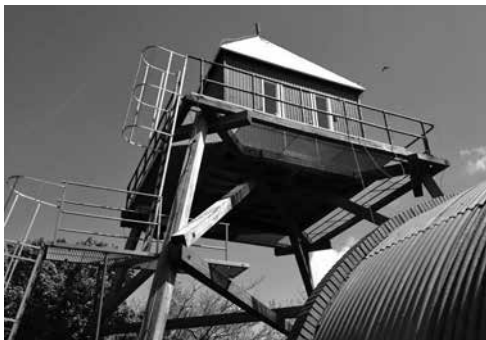
(Deel van de) Romneyhut en uitkijktoren op Rottumerplaat (foto: Vincent Veeger).

der ten anker. De bijboot wordt te water gelaten –daarvoor is het schip uitgerust met een kraan- en met Klaas als schipper gaan alle opstappers in de bijboot. Freek-Jan blijft aan boord en ook Geert blijft daar nog wat werken. Met de buitenboordmotor varen we richting Rottumerplaat. De vogelwachters staan al bij de plek waar we aan land kunnen. Zodra het water te ondiep wordt stappen we overboord. Het is daar 'laarsdiep', tot