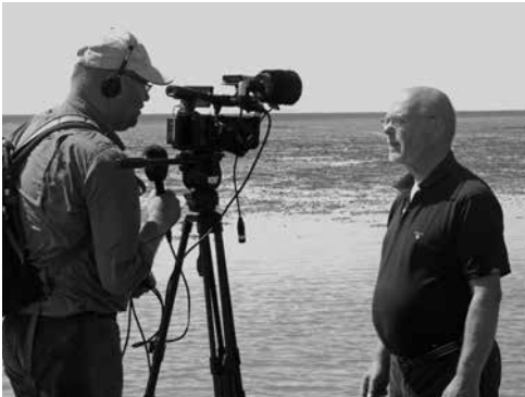
Onze voorzitter geeft een interview aan Omrop Fryslân.

Om half elf kwamen de zes kanoërs aan bij de Engelsmanplaat. Twee mensen gingen in een schuiltentje op de Hiezel (de hoge zandbank) monitoren. Vanaf de Krukel zagen ze de Scholekster die daar zat te broeden voorzichtig wegschuiven. Vier kanoërs gingen bij de Krukel even een bakje koffie halen en overleggen. Omdat de Krukel weinig kan zien van de westkant van de Engelsmanplaat, besloten ze naar het vogelwachtershuisje te gaan. De vogelwachters waren op de hoogte, de Krukel had hen verteld van de monitoringsactie.