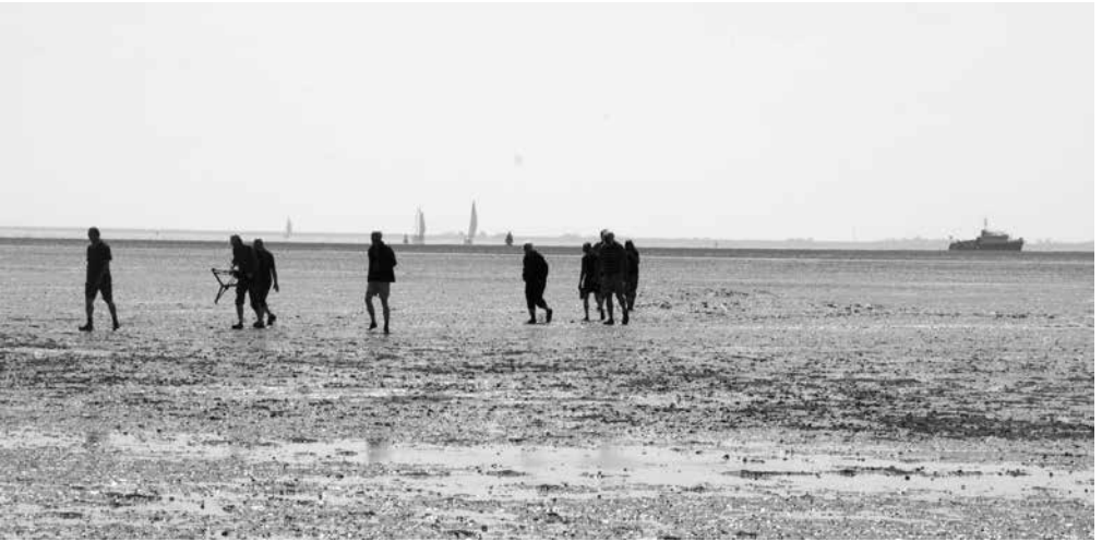
Negen mensen van de Krukel (op achtergrond) op de Engelsmanplaat.